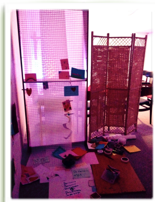
de gebedsruimte en een kinder-intentie: